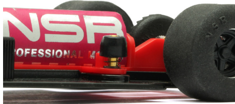
1299 Hard spring