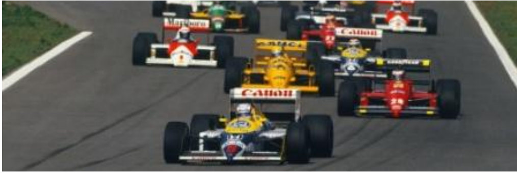
La prima batteria