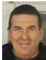
Ennesimo Grande Slam !

Cattivik ha fatto da "padrone" in pista. Questa sera nessuno era decisamente in grado di impensierirlo. La sua Audi veloce e stabile ha fatto corsa in solitaria dando più di 5 giri a Franco che ha fatto il secondo posto. Record sul giro in prova e in gara!