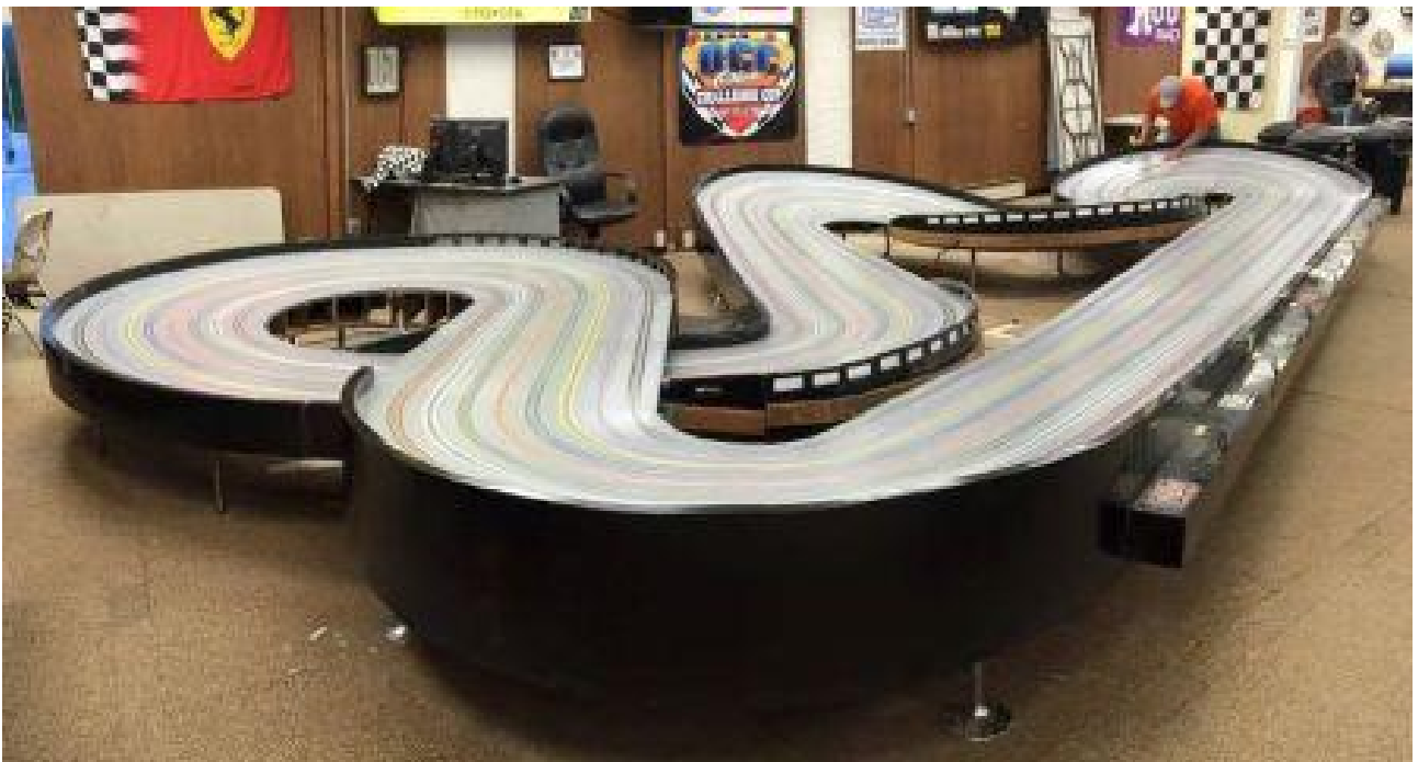
Black Royal, detta anche Mini King