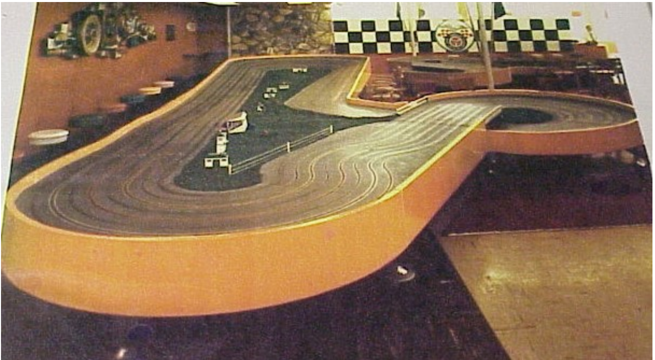
Orange "Monarch" 100'