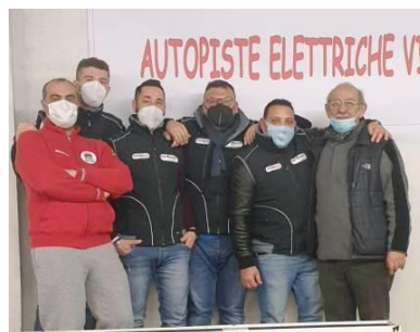
Gli amici di Sciaccia